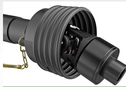
Modèle compact et masse basse