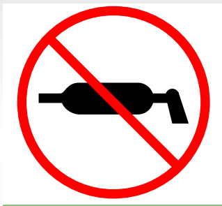
Maintien pas nécessaire