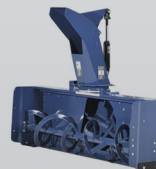
Souffleuses à neige