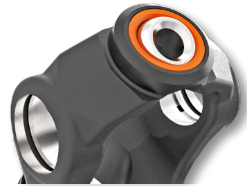
SISTEMA DE ROTAÇÃO (ESFERAS E SOQUETES) SELADO, E TRATADO TERMICAMENTE