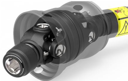
SISTEMA DE PROTEÇÃO PLÁSTICA ARTICULADA COMPACTA ANGULANDO ATÉ 80°