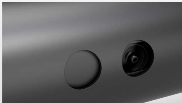
Leicht zugängliche Schmierstelle bei montierter Schutzvorrichtung