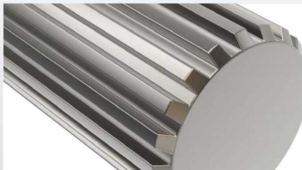
Mehrfache Kontaktpunkte für gleichmäßige Lastaufteilung reduzieren den Verschleiß